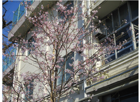
【正門の桜（ジンダイアケボノ）】