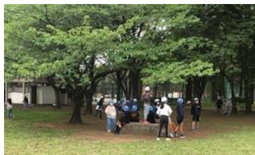
【公園でのレクリエーションの様子】

4年生。4月24日に遠足を行いました。「城北中央公園」へ行き、春を感じながら、ウォークラリー を行いました。担任の先生たち4人を見付けるのに苦勞していましたが、見付けたあとは、とても喜ん でいました。各学級でクラス遊びを考え、工夫して遊んでおり、自分たちで進められる4年生に感心し ました。