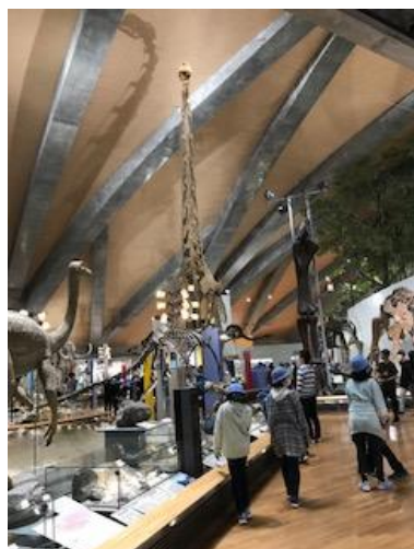
【首の長い恐竜の見学】

最終日は、午前中に群馬県立自然史博物館へ行き、午後は学校へと向かいました。博物館の中では、動く恐竜や動物のはく製など展示の工夫に驚きました。ここでも、子供たちはグループで協力して活動していました。