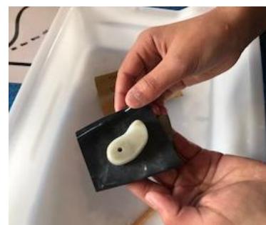
【勾玉の形に仕上げました】

初日には、群馬県の「かみつけの里」で、古墳を見たり、勾玉を作ったりしました。やわらかな石ではありませんでしたが、かなり集中して削らないと勾玉の形にはなりませんでした。その中で、どの児童も一生懸命自分のオリジナルの勾玉を作っていました。ペンダントに仕上げたときには、皆とても満足そうでした。次の日も晴れて、「東麓ノ登山」へ登り、午後はカーリングを体験しました。カーリングのストーンなど正式な物を使って試合も行いました。