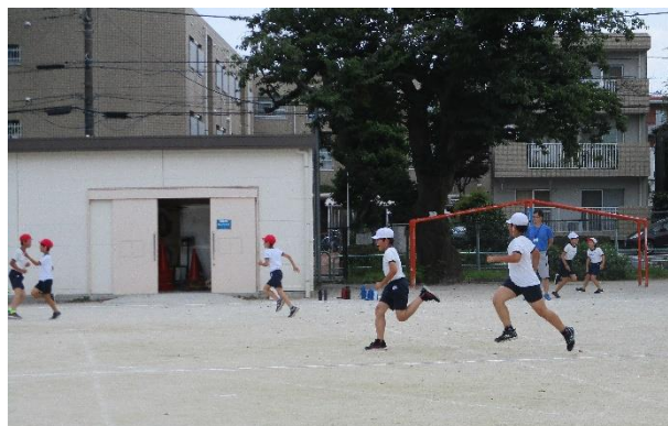
【クラブ活動で、増やし鬼をしている様子】

5年生は4年生の時に、総合的な学習の時間に障害のある方や高齢者の方などと施設の見学を通して学習をしてきた経験があります。人権の尊重とは、子供も大人も一人一人が大切にされ、安心安全が保障されていることです。学校でも、授業や行事、他の生活の場面などで自分や友達を大切にしていくことを指導の柱にしています。その中で、異学年の活動でも、互いを知り思いやる場面を見ました。例えば、一般運動クラブでは、4年生から6