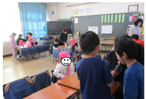
【交流会の本番の様子】

1年生の生活科「もうすぐ2年生」の学習で、1月の終わりに、学級ごとに保育園や幼稚園の年長さんを招いて、交流会を行いました。この単元は、自分自身の生活や成長を振り返ることや、次の1年生のために、伝えたいことなどを考える学習です。1月22日には、研究授業も行いました。内容は、「自分たちのアイデアを他のグループに見てもらって、よりよくしよう」というものでした。成長すごろくや等身大パネルでの説明もありました。「思ったよりうまくできたので、次はドングリランドをやってみたいです。本番もにこにこして