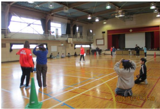
【ゴールボールのミニゲームの様子】

1月16日に、東京都の取組「笑顔と学びの体験活動プロジェクト」でゴールボールを6年生の児童が体験しました。パラリンピアンの方が2名、そしてコーチやスタッフの方も含めて、皆さんとても丁寧に教えてくださいました。ゴールボールは、目隠しをしながら鈴の入ったボールを交互に転がして、ゴールを目指すスポーツです。パラリンピックでは視覚障害者の正式種目となっています。3人対3人で行い、コートが大きさが決まっているので、一人3メートルずつ守って、9メートルを横に寝た状態でカバーするとよいと