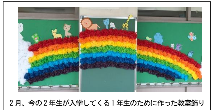
2月、今の2年生が入学してくる1年生のために作った教室飾り

2月までの子供たちとの当たり前の日々。そこには、子供たちの輝く笑顔と確かな成長がありました。こうした日々の日常に「みんなの幸せ」があったのだと、つくづく思い知らされています。新型コロナウイルスがさらに猛威を振るい、こうした日々が一変してしまいました。この感染症により多くの方が