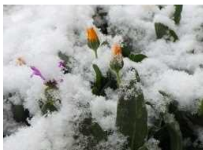
校庭の花壇にも雪が積もりました