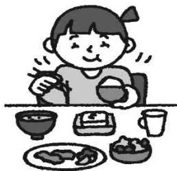
バランスのとれた食事