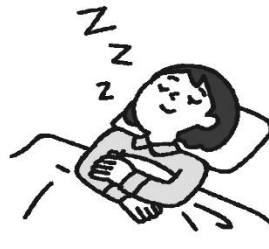
じゅうぶんな睡眠