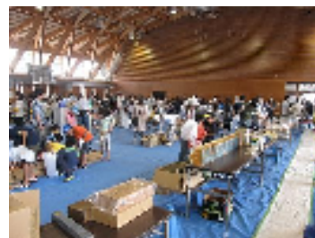
体育館で行われた周年バザー

周年行事に向けたバザーでは、 ※1 多大なご協力のもと資金を確保することができました。