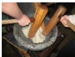
葉かげの会(もちつき)イメージ

※3 運営委員会の開催は年三回ですが、小P連や地域の行事が続く場合は、P役員だけで集まり数回打ち合わせを行っています。