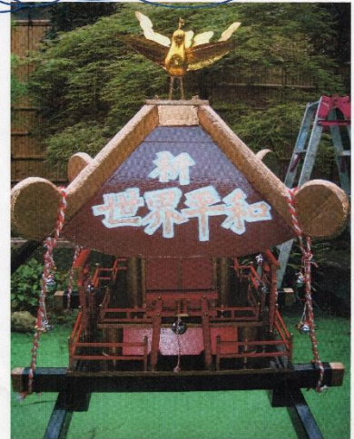
平成20年9月14日・広場の祭典 第六地区・青少年育成委員会