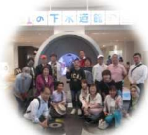
虹の下水道館見学