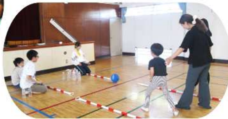
ペットボトルボーリング