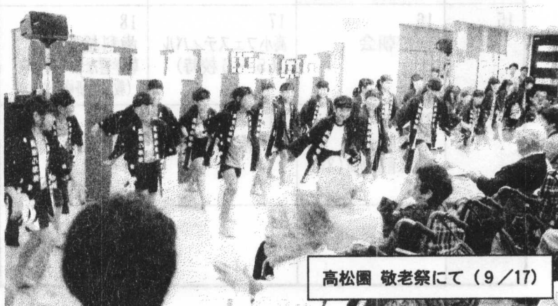
高松園 敬老祭にて(9/17)

■26日(木)2校時に、2004年アテネパラリンピック金メダリストの高橋勇市さんをお迎えして、オリパラ教育を実施します。高橋さんは、視覚障害の陸上競技・マラソン選手でパラリンピックを初め、様々な大会に出場し世界最高記録での優勝やマラソンの日本記録を樹立した経歴があります。子供たちの今後に繋がる貴重なお話をたくさん伺いたいと思います。