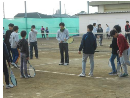
部活動体験（運動部）