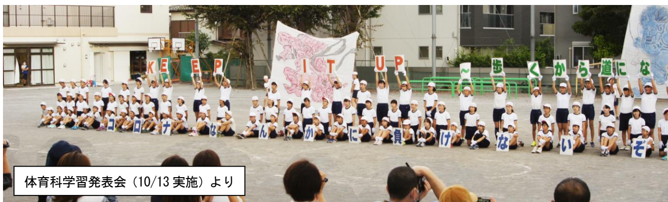
体育科学習発表会 (10/13 実施) より

■給食費の引き落とし日が11日(水)です。6,500円ですので、口座残高をご確認ください。