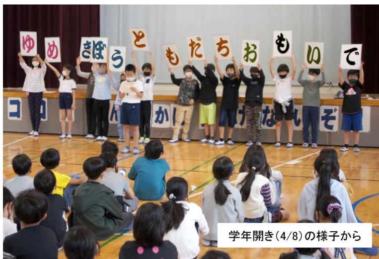
学年開き(4/8)の様子から

進級に伴う心の高鳴りの季節が過ぎ、子供たちの乗る船は更なる高みである沖合へと針路を進めていきます。確かに、これからは当たり前の日常が過ぎていくだけの、静かな日々かもしれません。でも、それら一つ一つの授業や行事などの営みこそが「充実の時」に他ならないのです。