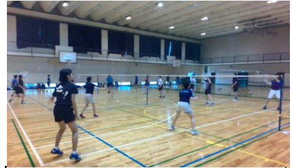
DVDによる部活動紹介