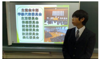
DVDによる中学校紹介