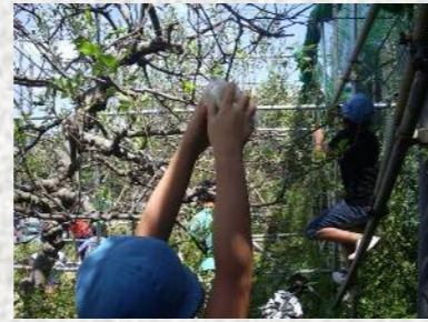
5年生の総合的な学習の時間。校庭で育てているリンゴの受粉をさせています。