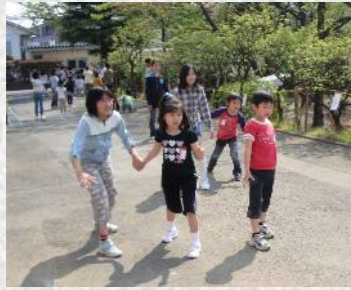
みんな生き生き。春日町保育園との交流会。