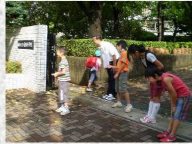
代表委員会や6年生の「あいさつ運動」。気持ちのいいあいさつが響きます。