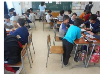
中学校での授業体験 (3月)