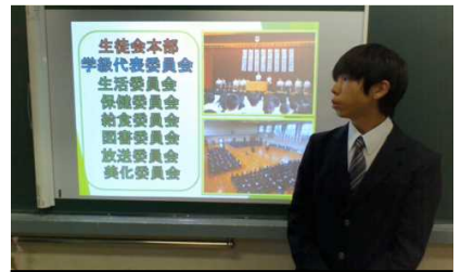
DVDによる中学校紹介