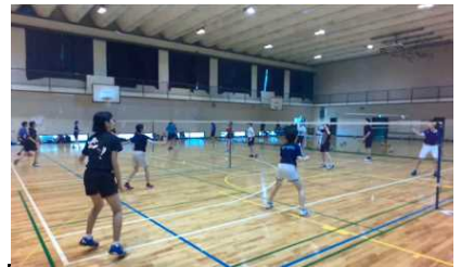
DVDによる部活動紹介