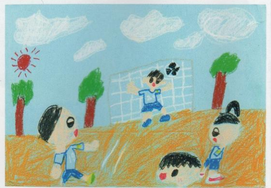
ナイス シュート (色画用紙/クレヨン /27×39cm)