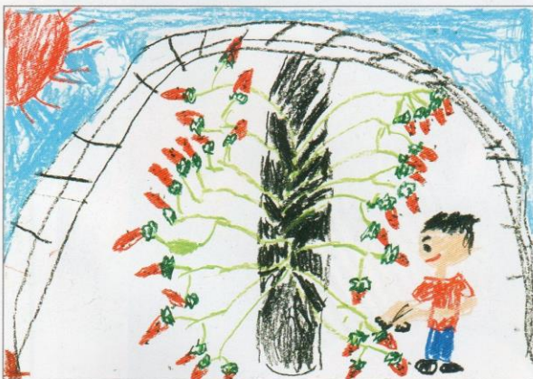
たのしい いちごがり (パス/27×38cm)