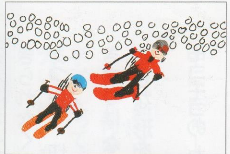
スキーは さいごう (カラーペン/27×38cm)