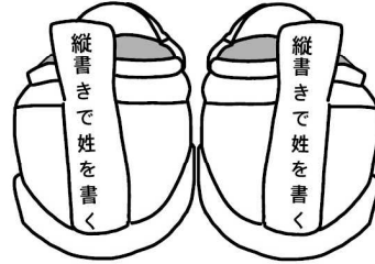
かかと(上履き後ろ)