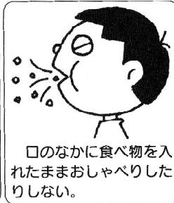
口のなかに食べ物を入れたままおしゃべりしたりしない。