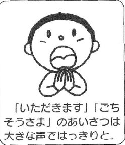
「いただきます」「ごちそうさま」のあいさつは大きな声ではっきりと。