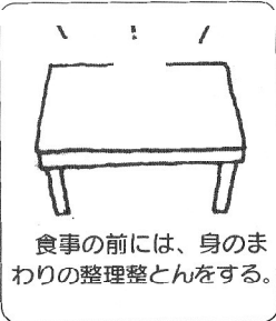
食事の前には、身のまわりの整理整頓をする。