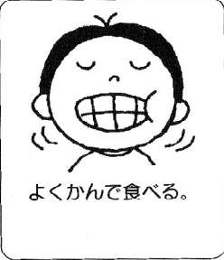
よくかんで食べる。