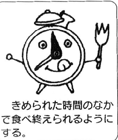
きめられた時間のなかで食べ終わられるようにする。