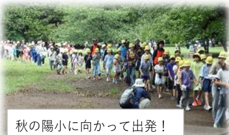
秋の陽小に向かって出発！