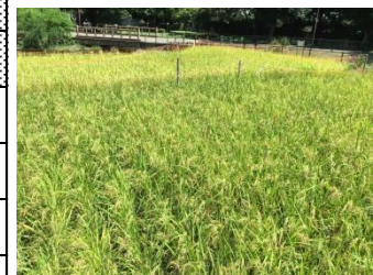
9月13日に稲刈り予定の秋の陽田んぼの稲穂

9月10日(土)、区一斉防災訓練(引取訓練)終了後、親子防災訓練を実施します。別途ご案内の通り、低・中・高学年により訓練内容は異なります。炊き出しの試食(麻婆丼)は全員分ありますので、奮ってお申し込み、ご参加ください。