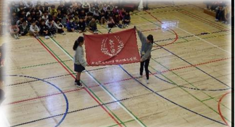
校章旗の引き継ぎ