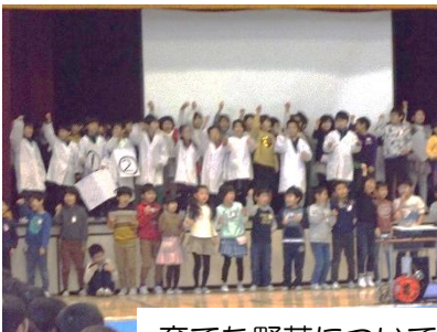
育てた野菜について、みんなで発表しました