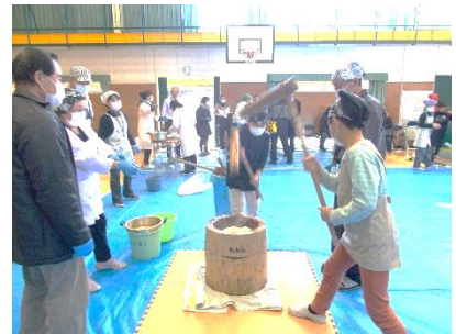
おもちをカいっぱいつきました