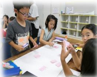
3年2組社会 「安全なくらしを守る」

運動会や学芸発表会の練習では、みんなで話し合って自分たちがよりよくなるためのめあてを考え取り組みました。その後もそのめあてを意識して毎日頑張っています。