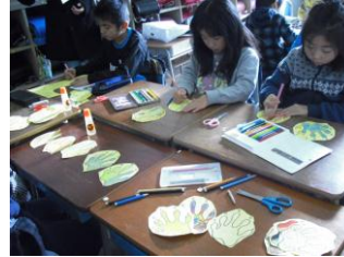
足あとチーム 足あとに色や模様を つけ切り抜き、廊下や 壁にはります。