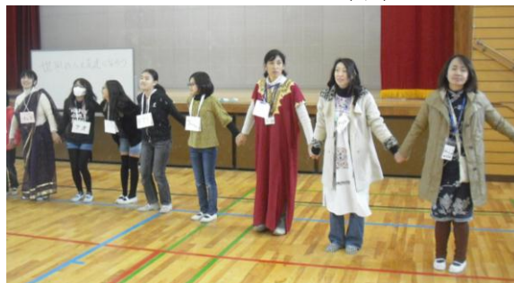
6年生 ヒップファミリークラブ さんと八か国語で挨拶・多 文化体験。