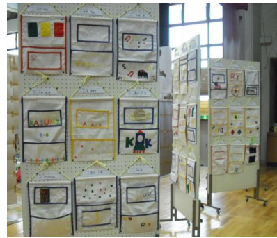
5年 ウォール ポケット