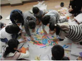
動物チーム 色や形を工夫して はり絵で動物をし あげます

学校中をたくさんの足あとでうめつくします。みんなでその足あとをたどっていくと・・・さて。何が!! 6年生—1年生 2年生—4年生 3年生—5年生がいっしょになって 全校で18チームができました。