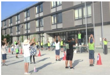
早朝6時半からのラジオ体操

暦の上では「処暑」を過ぎ、暑さが落ち着く頃とされていますが、まだまだ厳しい残暑が続いております。