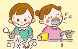
てあら 手洗い・うがいをする

校内では現在、インフルエンザの感染が広がっています。咳や発熱などの症状でお休みする児童も増えてきました。感染を防ぐためには、日頃からの予防と早めの対応がとても大切です。学校だけでなく、御家庭での健康管理や体調チェックにも御協力をお願いします。