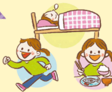
きそくただ 規則正しい生活をする