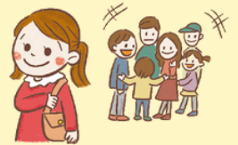
ひとご 人混みを避ける