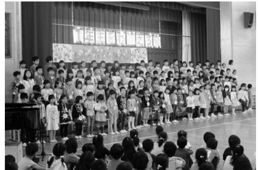
1年生を迎える会（校歌）

新しい学年になって1ヶ月が過ぎました。1年生は、登校、授業、休み時間、給食、下校という一日の学校生活に段々と慣れてきました。2年生から6年生も新しい学年に対する意欲あふれる姿があちこちで見られます。朝の出会いも、「おはようございます」と元気なあいさつから始まる子どもたちが増えてきているように感じます。また、授業中、姿勢を正して先生や友だちの話を真剣に聞き、考えている姿を見ると、学年が一つ上がって、それぞれお兄さん、お姉さんになったのだという自覚がひしひしと伝わってきます。