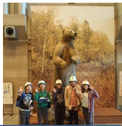
「地球博物館」には地球の不思議がたくさんつまっていました。

移動教室のめあては、 「自然・文化・人々とふれ合おう」 でした。この他にも、バスレク、室内レク、肝試しやグループタイムなどの経験を通し、この目標が達成できたようです。早くも、「来年度の移動教室が楽しみ！」という声がたくさん聞かれ、とても楽しい移動教室となりました。