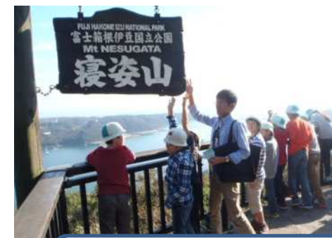
「寝姿山ロープウェイ」に乗って寝姿山の山頂に行くと、下田の港が一望でき、黒船や市場等がよく見えました。