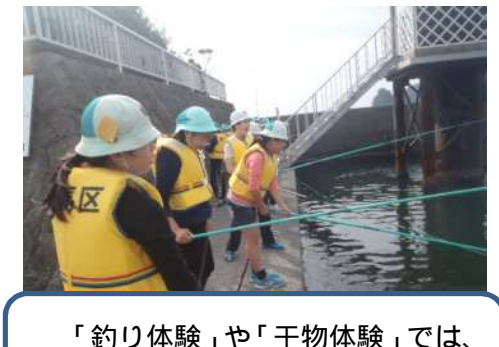
「釣り体験」や「干物体験」では、生の魚の感触に驚いていました。