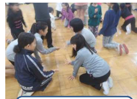
室内ゲームの「進化じゃんけん」は大盛り上がり！