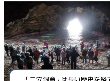
「二穴洞窟」は長い歴史を経てつくられたもので、とても幻想的でした。上から見ると、写真のようにハート型に見えるのも素敵ですね。