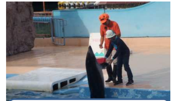
「下田海中水族館」では、代表の児童がイルカと握手しました。