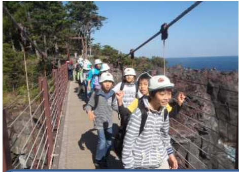
「城ヶ崎ピクニカルコース」の吊り橋は、海面からの高さがあり、迫力満点でした。波音を聞きながらのハイキングは、とても気持ちよかったです。