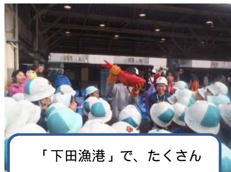
「下田漁港」で、たくさんの金目鯛が見られました。