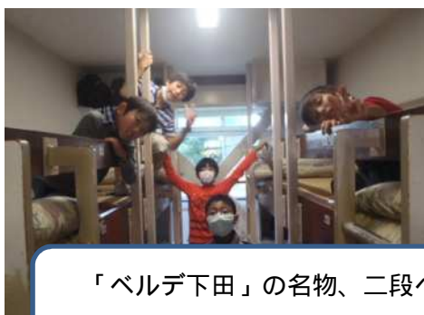
「ベルデ下田」の名物、二段ベッドです。グループタイムでは、トランプやおしゃべりをしながら楽しく過ごせました。