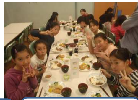
美味しい食事を、たくさんいただきました。