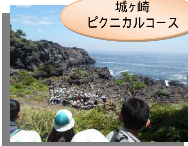
城ヶ崎 ピクニカルコース

海沿いの道を歩きながら、潮風と潮の香りを満喫。珍しい鳥や蛇など、生き物もたくさん見つけました！