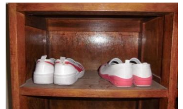
つま先を奥にして、靴箱の名前や番号の下にそろえて入れる