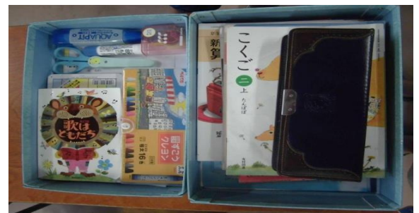
道具と、教科書・ノートは、分けて入れる