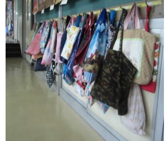
ろうかのフックに、きちんとかける