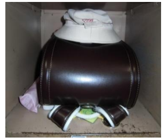
ロッカーはいつもきれいにこたう