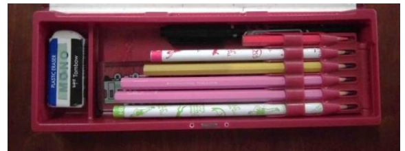
鉛筆は毎日家でけずって、ふで箱に入れる