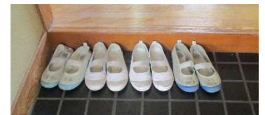
履物がそろうと気持ちがそろう(宿泊先にて)

ベルデ軽井沢の館長さんが、自然観察の際に、次のようなお話をしてくださいました。「この森の中に、人工物を隠しました。いくつ隠されているのかを探して数えてもらいましたが、全ての人工物をすぐに見つかった人はいませんでした。人工物なのだから、すぐに見つけれられると思ったことでしょうか。しかし、実際に探してみると、すぐに見つかるもの、注意してよく見ないと見つけ出すことができないものもあるということが分かったと思います。これは、私たちの仲間同士にも言えることのように思います。相手の良いところというのは、よく見ないと分からないことがたくさんあるということです。この移動教室を通して、友達の良いところやすてきなところをたくさん見つけることができたと思いますが、まだまだ見えていないことがたくさんあるのではないのでしょうか。これからの学校生活の中で、ぜひ、まだ見えていない良いところを見つけてください。一方、悪いこと、よくないことというのは、すぐに目に付くものです。そういったときには、よく話し合いをしてみると、解決したり分かり合ったりできるのではないかと思います。」行事を通して学ぶこと、それは、友達と協力して活動できること、相手の気持ちを大切にしようとして行動できることは、こんなにも嬉しくて素晴らしいことなのだと、いうことに気付くことができることです。日常の生活の中でも、その嬉しい気持ちをたくさんもつことができるように、互いに良いところを見付け合っていくことを大切にしていきたいものです。