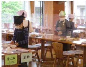
係の仕事は、責任をもって

集まったらおしゃべりせず話を聞く姿勢をとること、上履きやトイレのスリッパを整理すること、自分の役割に責任をもち、皆のためにできることに最善を尽くすこと、協力することなど、大四小の5年生、6年生は、果敢に挑戦しました。仲間と心を合わせて活動しようと努める意欲は、最後まで途切れることはありませんでした。1日の終わりには、グループごとにその日の行動を振り返り、課題の改善策も話し合っ、次の日の行動に生かすことができた6年生。宿泊先のベルデのスタッフの方からも、初めての移動教室とは思えないくらいメリハリのある行動ができていて、何よりも挨拶がしっかりとできていることが素晴らしいと褒めていただいた5年生。集団行動のルールを守り、自分ができることを率先して行い、友達との関わりを大切にして行動することに全員で取り組むことができた子供たち。大四小の頼もしいリーダーたちです。