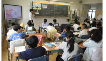
6年社会「大陸に学んだ国づくり」

生活科は、体験や活動を通して学ぶ学習です。教師が知識を教えて分からせるのではなく、子供たちが身近な人々、社会や自然と「自分との関わり」に気付き、自分自身や生活について考えます。社会科は、問題解決的な学習のかたちをとりながら、知識だけでなく空間的・時間的・相互関係的な見方・考え方などを使って、調べたり考えたり表現したりしながら社会を理解します。本校では、昨年度と今年度、校内研究で生活科・社会科を研究教科として、生活科の学習、社会科の学習とも、子供たちが問題を自分ごととして捉えられるように実践的な研究を行っています。