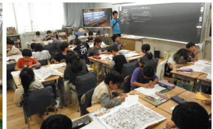
3年社会「商店の仕事」