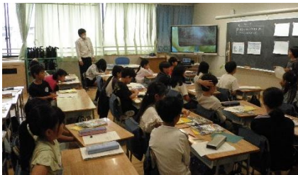
4年社会「ごみの処理と再利用」