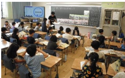
1年生活「わくわくどきどきしょうがっこう」

1学期も各学年の学級で、様々な授業が行われました。公立小・中学校では、校長・副校長が年間2回から3回程度、各学級の担任・専科教員の授業観察を行っています。今学期、通常の学級の担任の授業については、生活科・社会科を中心に校長・副校長が授業の様子を見て、指導・助言を行いました。