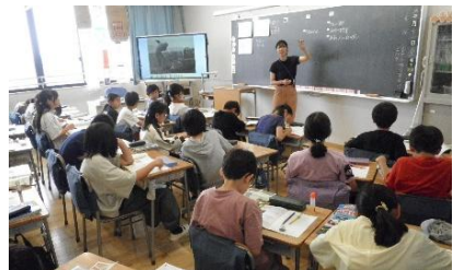
5年社会「自然条件と人々の暮らし」