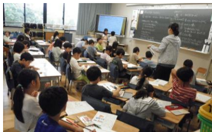
2年生活「まちが 大すき たんけんたい」