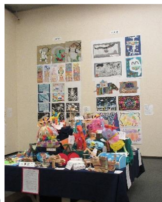
(図工部 連合図工展担当)

本校からは今年度は1年生から6年生まで24名と、さくら学級から3名の作品が出品されました。