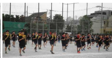
2年表現「2024 大東 よさこいキッズ」