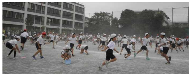
全校競技「おどって めくって 大東」