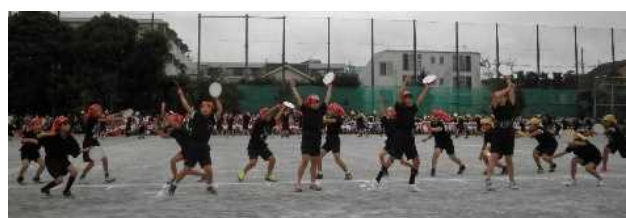
4年表現「あしびなエイサー2024」