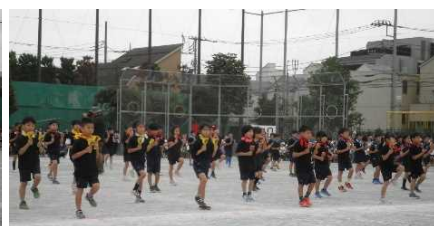
2年表現「2024 大東 よさこいキッズ」