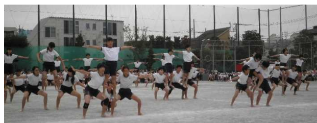
6年表現「組体操～成長～」