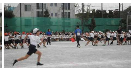
3年競技「オーエス！追いかけて綱引き」