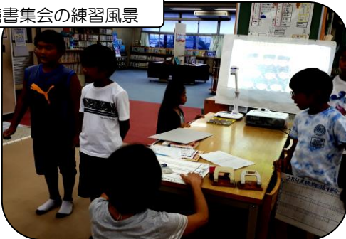
読書集会の練習風景