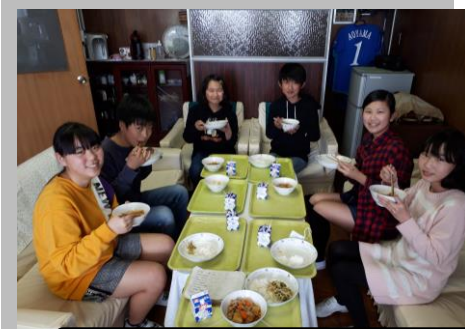
もうすぐ卒業！校長室で給食を

前述の四名の児童はもとより、本校児童一人一人が恐れることなくリーグの経験をすること、それが、リーグを支える場面でも、一致協力して社会全体を良くしていこうという資質を培うことに繋がると私は考えます。