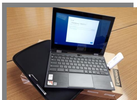
学校HPに研究授業を掲載しています

私達の生活はどんどんデジタル化し、AIなどの新たな技術が生まれ、十年先の未来すら予測することが困難です。そんな時代の子ども達に望ましい教育とは何かと考えたとき、「コンピュータを受け身ではなく、積極的に活用する力」や「プログラミング的思考」が求められる、と中央教育審議会が結論付けた結果、学習指導要領にプログラミング教育の必修化が明記されました。算数科と理科の授業が例として示されましたが、どの教科・領域でもプログラミング教育を行うことは可能です。