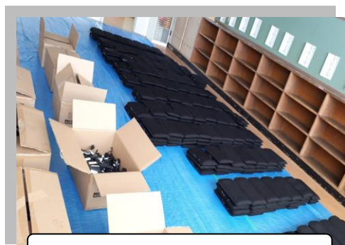
2月19日に届いたタブレット端末

四時間目終わりやっとな給食。今日は大好物の練馬スパゲッティー。放送委員会がZoomで楽しい話題やクイズをやってくれるので、おしゃべり無しも苦にならない。 六時間目終わり「さよなら。」家に帰ったら手洗い・うがいをしてからタブレット起動。担任の先生から動画メッセージが届いている。今日の授業の大切なポイント等と宿題の指示だ。宿題は漢字百字練習帳、兎に角たくさん書かないと漢字は覚えられないからね。まだ余裕があるなあ。では「じがく」でもやるか。校長先生のYouTube Channelで月と太陽のことをやってたけど、今ひとつ分からなかったから、インターネットでNHK for Schoolを検索してO24Noteにまとめてみよう。 おっと九時になった。十時にはタブレットが使用できなくなるのでここでおしまい。歯を磨いて、タブレットをお家の人に預けて「おやすみなさい。」充電も忘れずに。