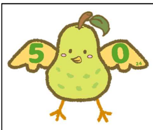
にしっぴー 作者 6-2 野崎 梨乃さん