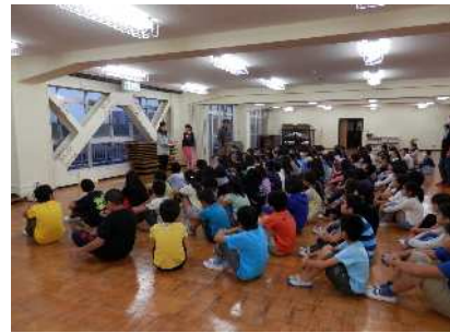
室内レクリエーション

11月～2月の校庭開放は、毎週水曜日の午後2時15分～4時の間となります。(土・日・休は、午後1時～4時)