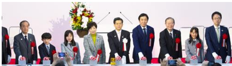
前川練馬区長・小池東京都知事・石井国土交通大臣と発進式