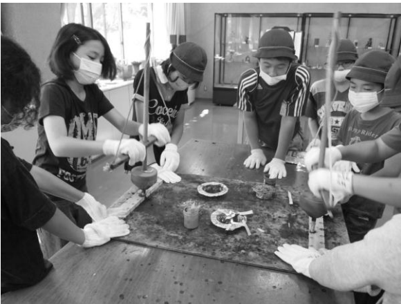
ともしび館で 火おこし体験

4日間の移動教室が終わりました。楽しかったこと、頑張ったこと、失敗してしまったこと、どれも子供たちにとって良い経験となりました。