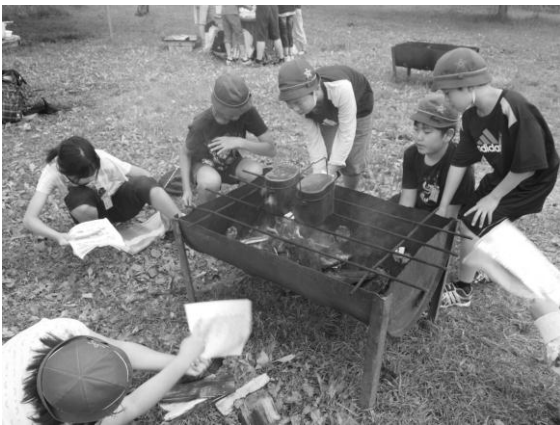
鷹山ファミリー牧場で 飯ごうバーベキュー