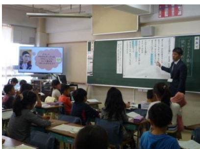
「声に出してたのしもう てのひらを太陽に」の様子