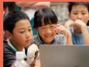
※2025年度プログラムの様子