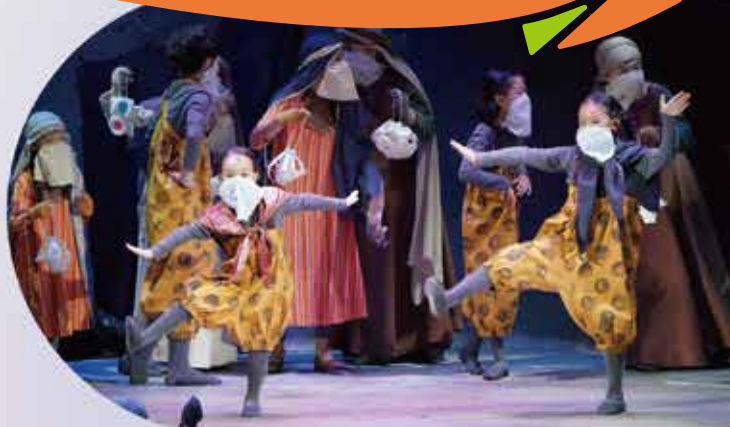
2020年公演写真