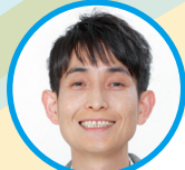
芸人・漫画家 矢部 太郎 氏